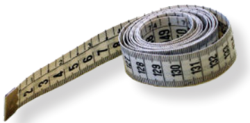
Metro a nastro

In questo documento illustriamo qual è il metodo per rilevare i valori in maniera tale da ottenere un preventivo di spesa attendibile.